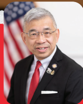
贊助人 州眾議員 鄭永佳